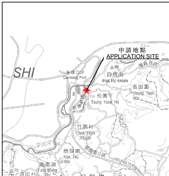
要覽圖 KEY PLAN SCALE 1:50 000 比例尺