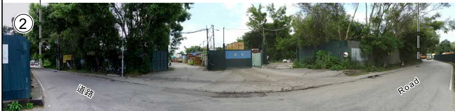
申請地點 APPLICATION SITE