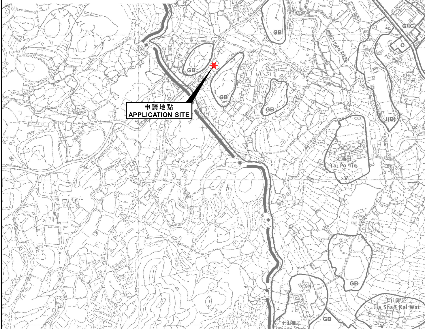
位置圖 LOCATION PLAN