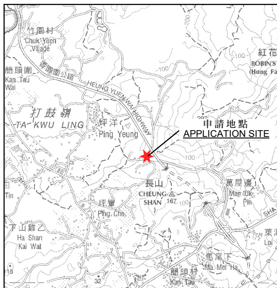
要覽圖 KEY PLAN SCALE 1:50,000 比例尺