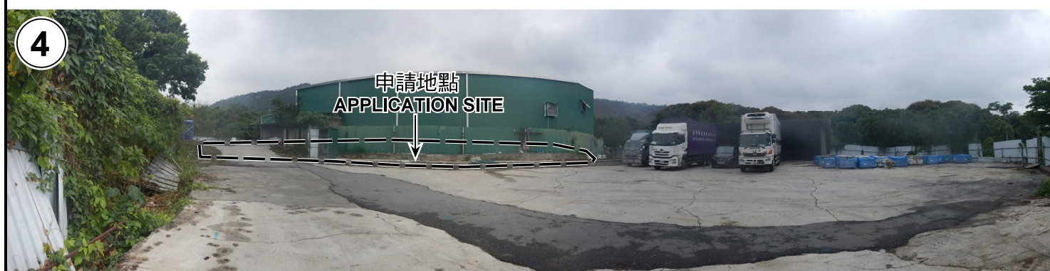
申請地點界線只作識別用 APPLICATION SITE BOUNDARY FOR IDENTIFICATION PURPOSE ONLY