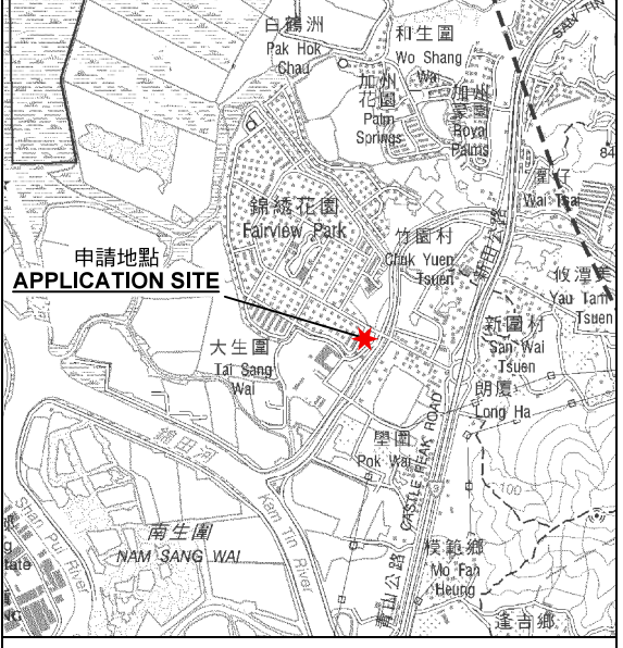
要覽圖 KEY PLAN SCALE 1 : 50 000 比例尺

申請地點界線只作識別用 APPLICATION SITE BOUNDARY FOR IDENTIFICATION PURPOSE ONLY