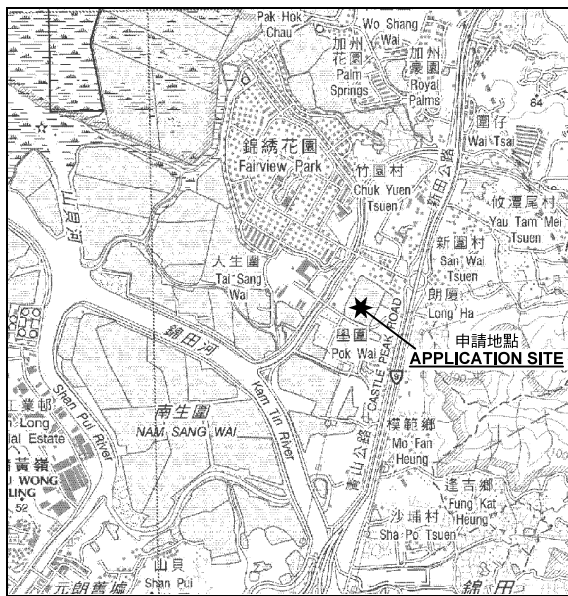
要覽圖 KEY PLAN