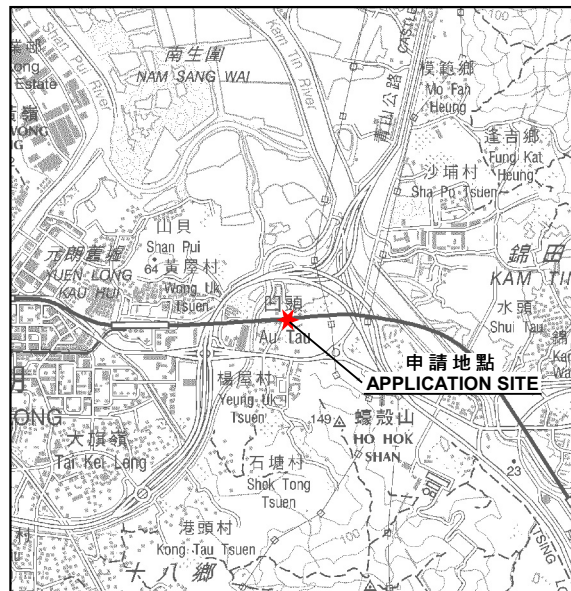
要覽圖 KEY PLAN SCALE 1 : 50 000 比例尺

申請地點界線只作識別用 APPLICATION SITE BOUNDARY FOR IDENTIFICATION PURPOSE ONLY