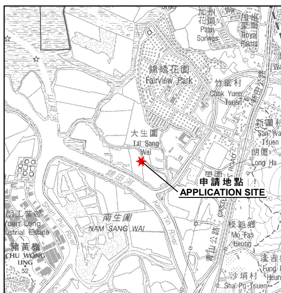
要覽圖 KEY PLAN SCALE 1 : 50 000 比例尺