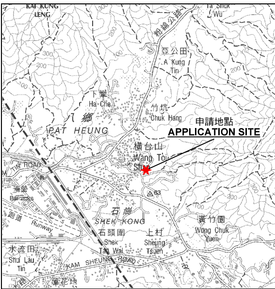
要覽圖 KEY PLAN