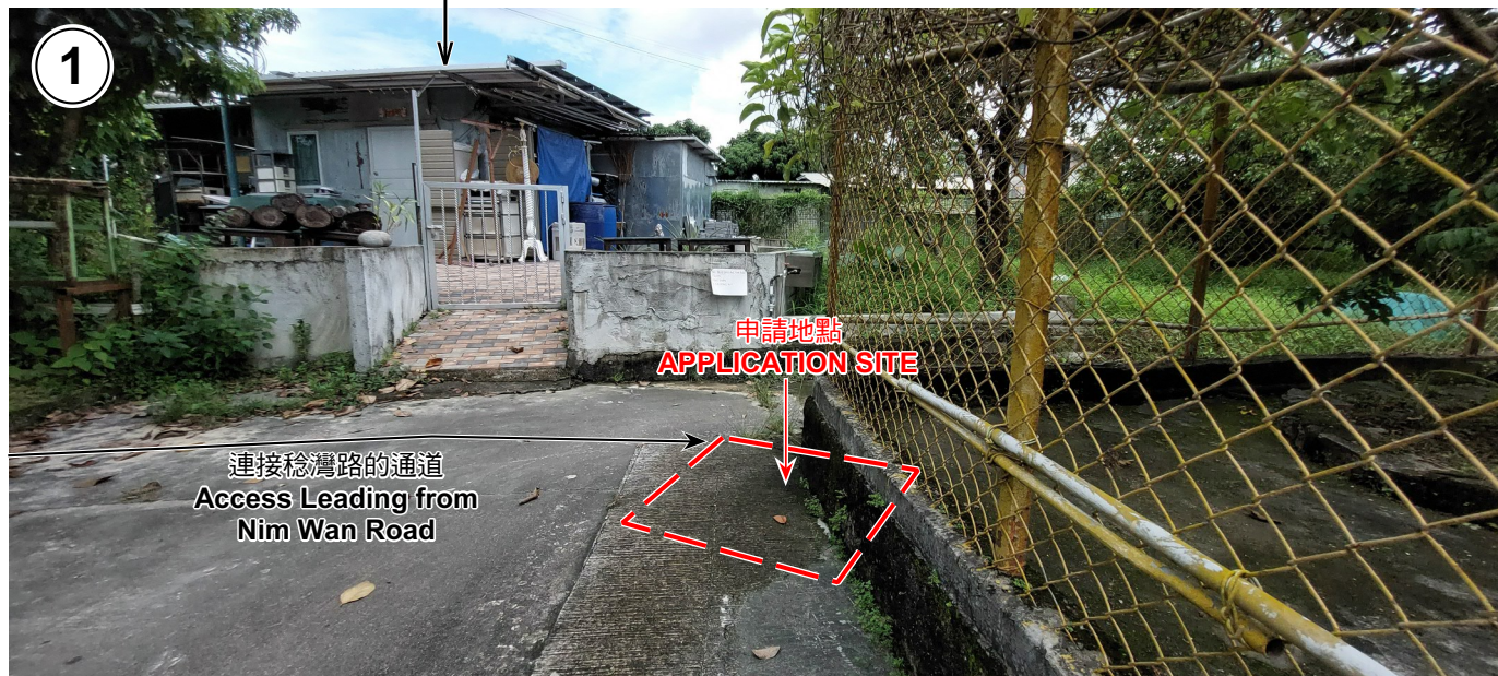
上白泥第26G號 No. 26G Sheung Pak Nai