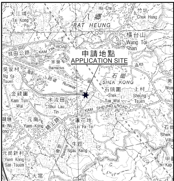
要覽圖 KEY PLAN