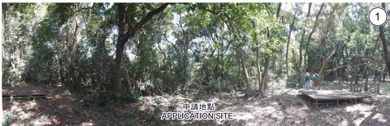
申請地點 APPLICATION SITE