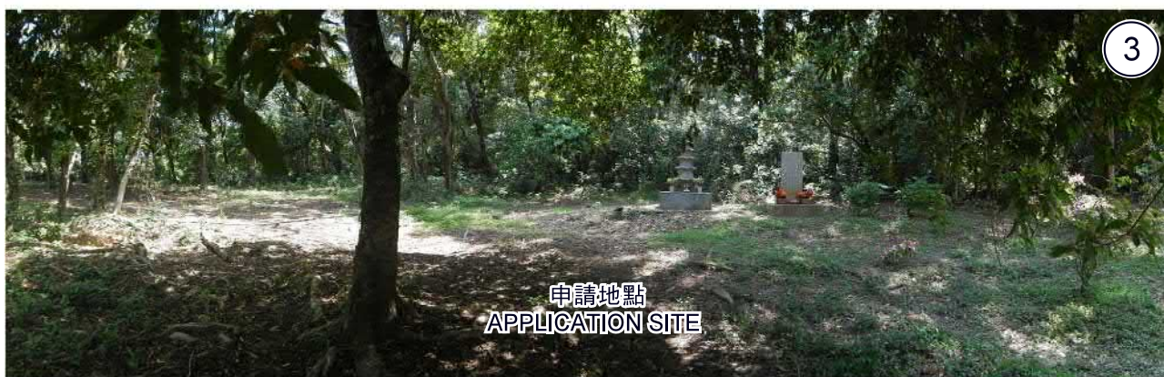
申請地點 APPLICATION SITE