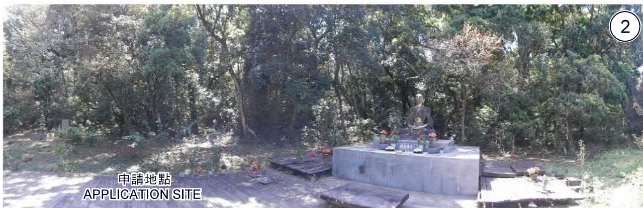
申請地點 APPLICATION SITE