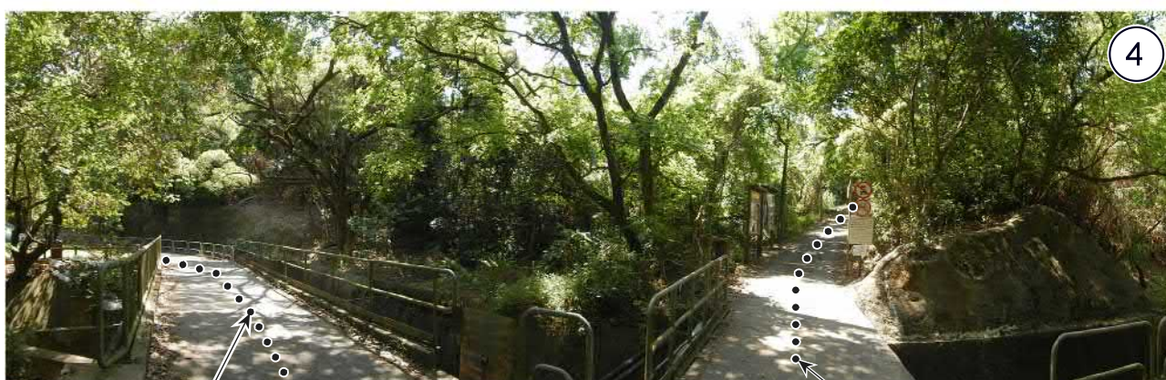
連接荃錦公路的通道 Access Leading from Route Twisk