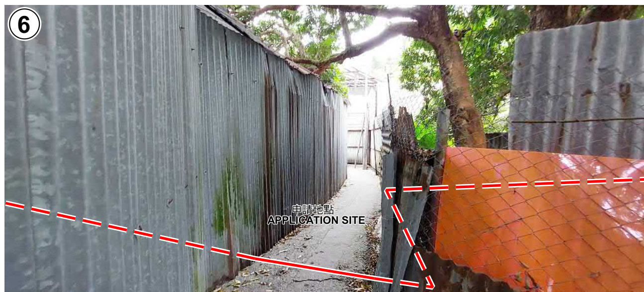
申請地點界線只作識別用 APPLICATION SITE BOUNDARY FOR IDENTIFICATION PURPOSE ONLY