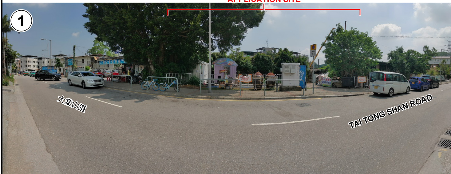
申請地點 APPLICATION SITE