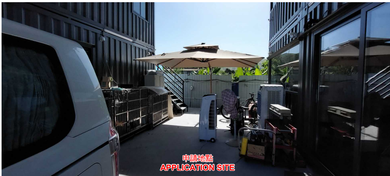
申請地點 APPLICATION SITE