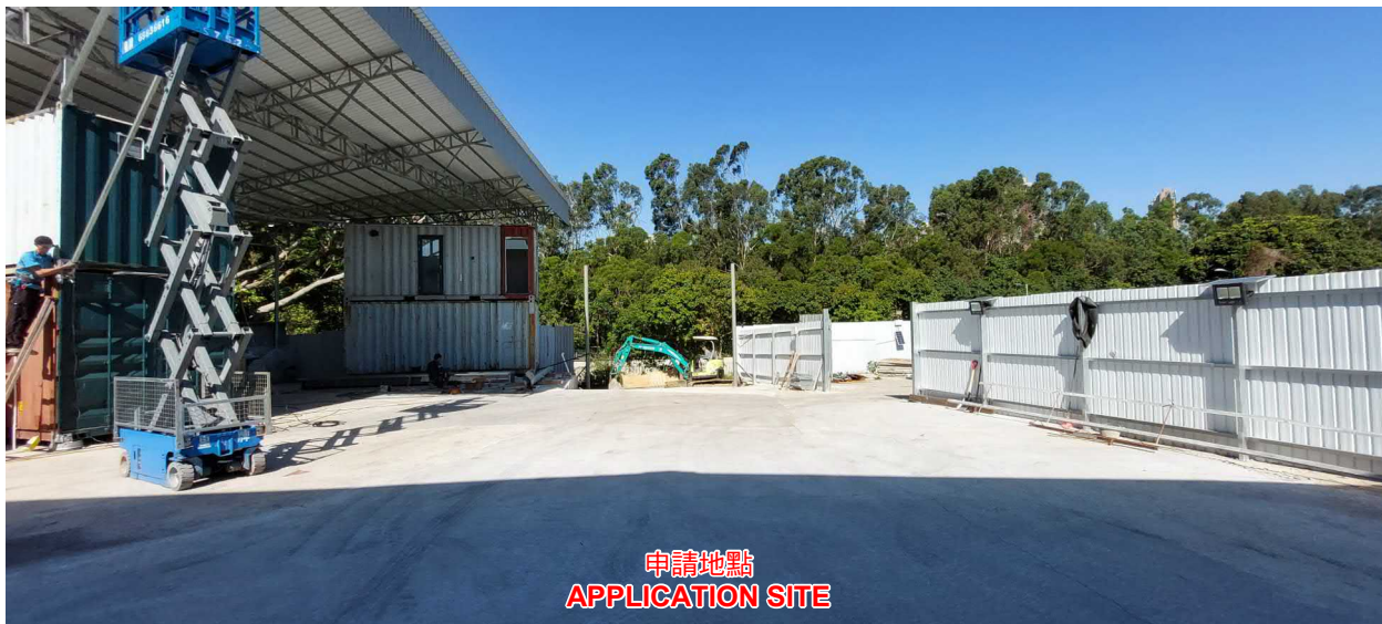
申請地點 APPLICATION SITE