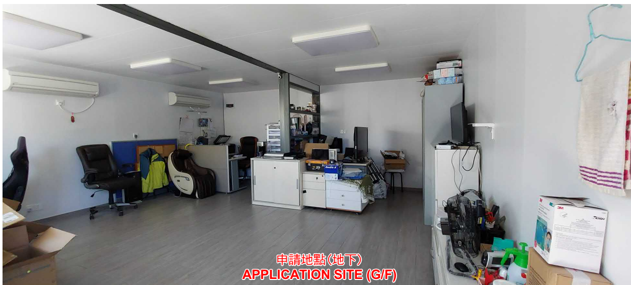
申請地點(地下) APPLICATION SITE (G/F)