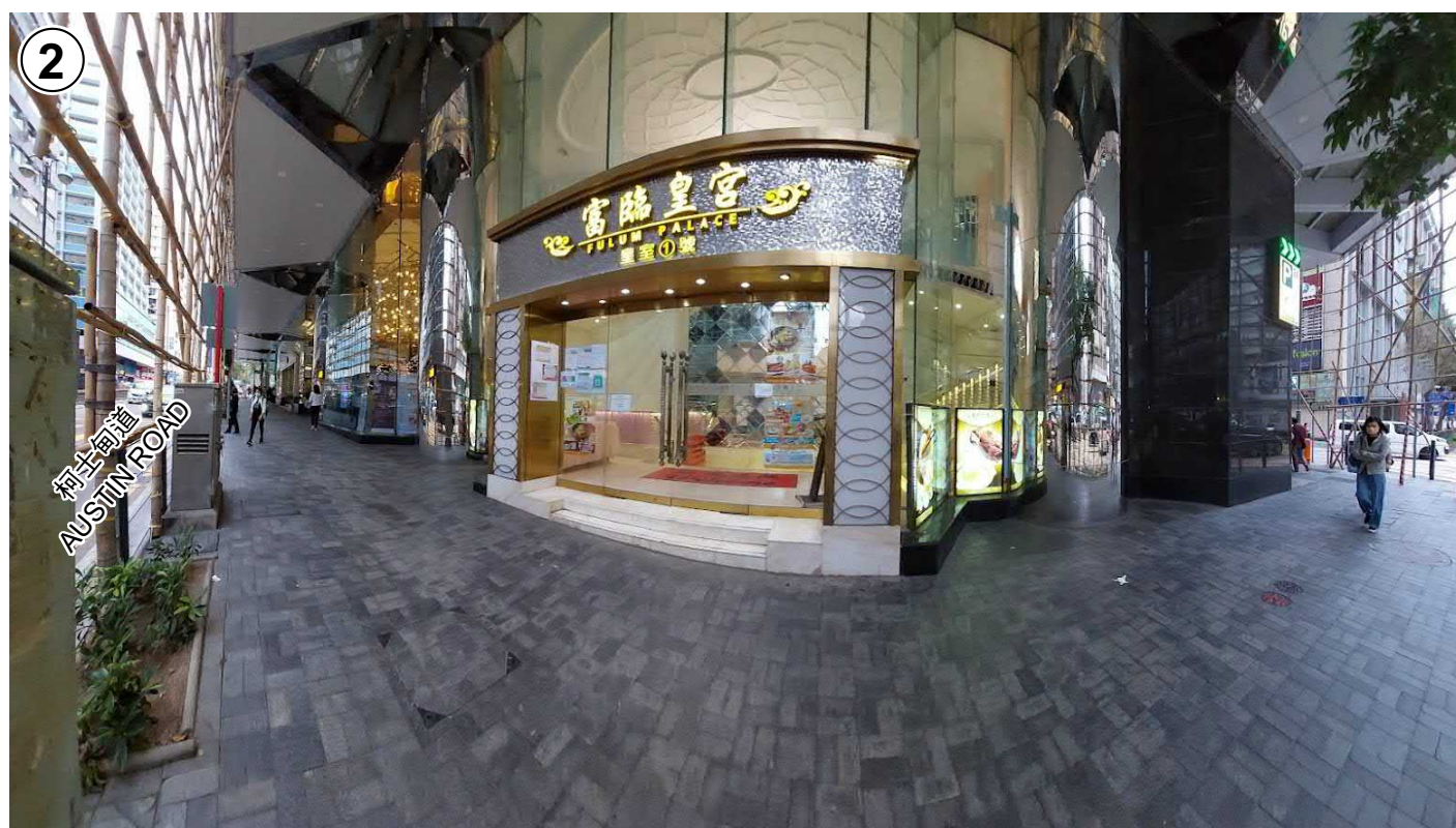
通往申請處所的入口 ENTRANCE TO THE APPLICATION PREMISES