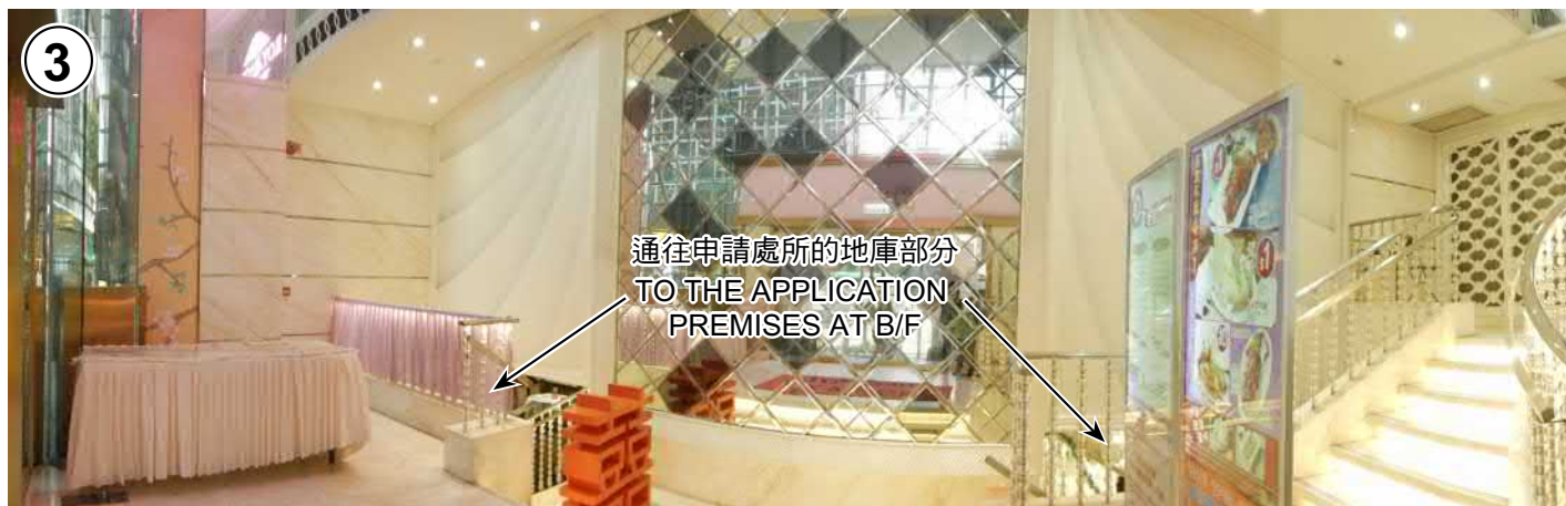
申請處所的地面部分 G/F OF THE APPLICATION PREMISES