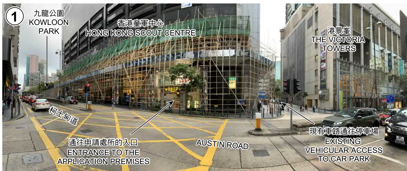
由柯士甸道通往申請處所的入口 ACCESS TO THE APPLICATION PREMISES FROM AUSTIN ROAD