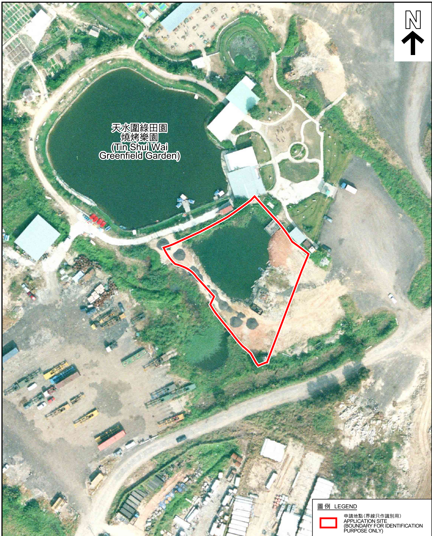
天水圍綠田園 燒烤樂園 (Tin Shui Wai Greenfield Garden)